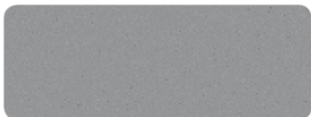
GRAU , Perlmutter matt, x=42